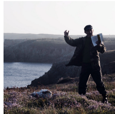
Nouveau monde! (Le Monde à nouveau) di Nicolas Klotz, Elisabeth Perceval